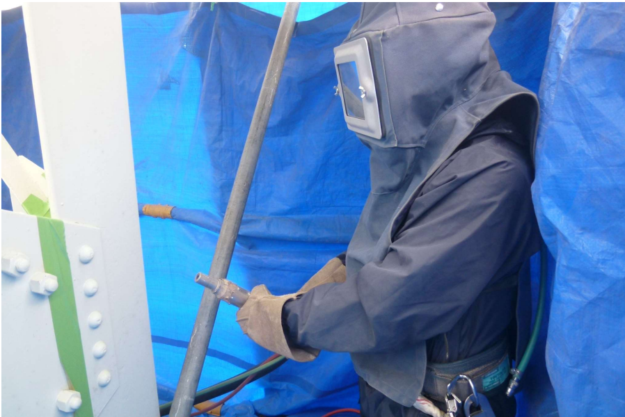
【工事種目】溶射工事