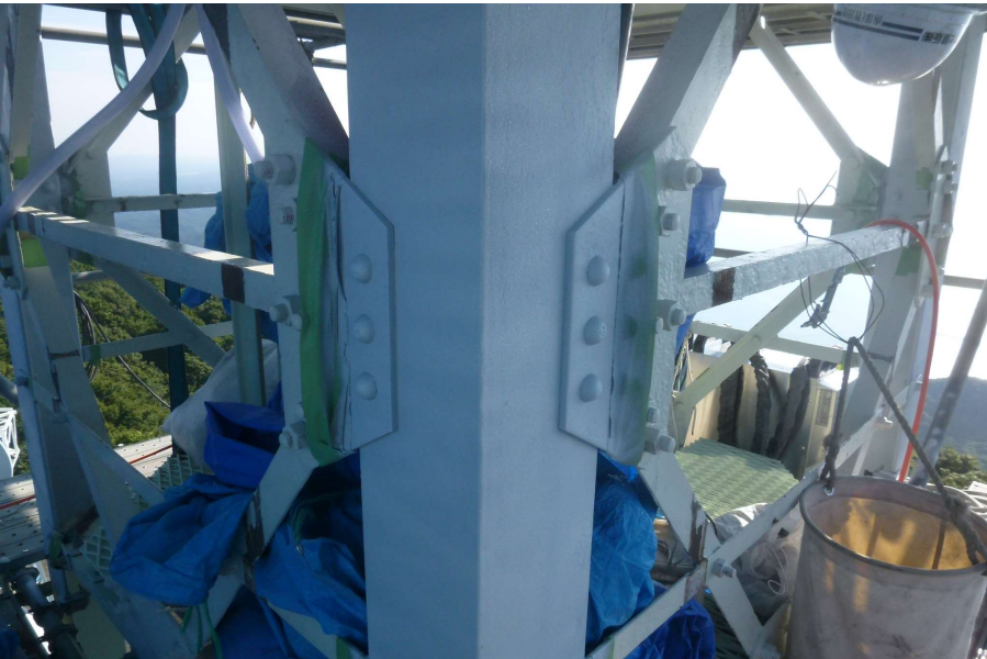
【工事種目】溶射工事