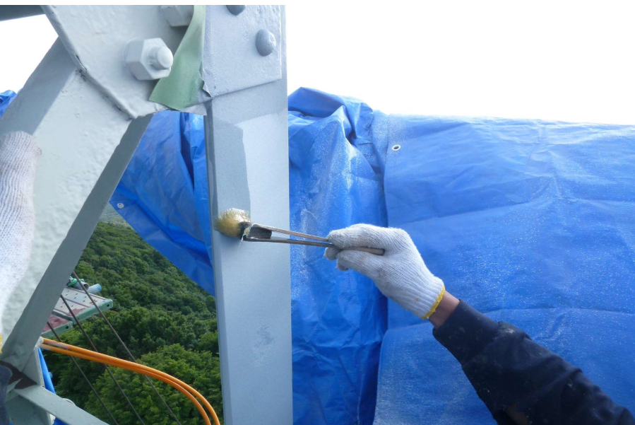
【工事種目】溶射工事