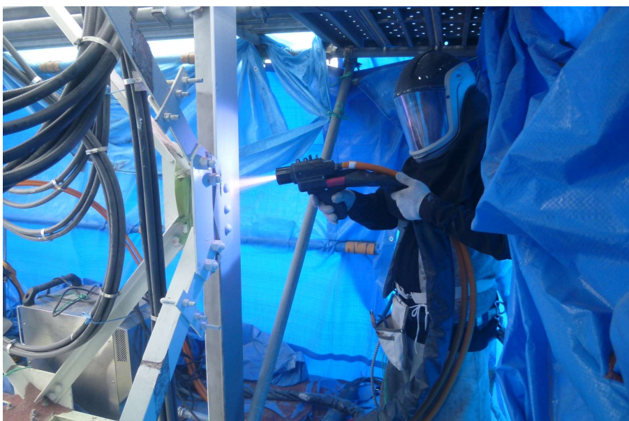
【工事種目】溶射工事