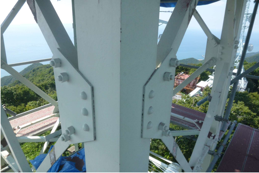
【工事種目】溶射工事