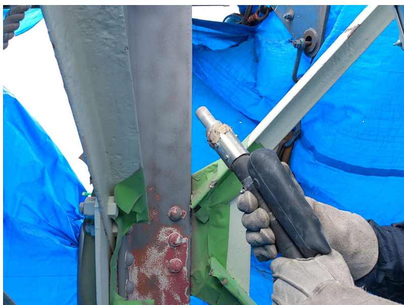
【工事種目】溶射工事