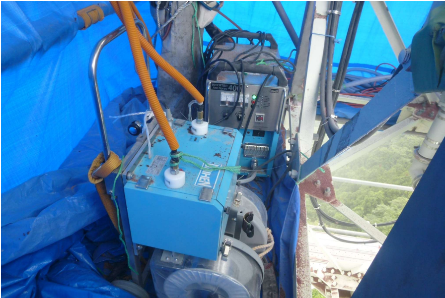
【工事種目】溶射工事 【施工内容1】溶射機材 【施工内容2】溶射電源・搬線装置