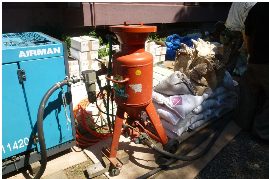
【工事種目】溶射工事