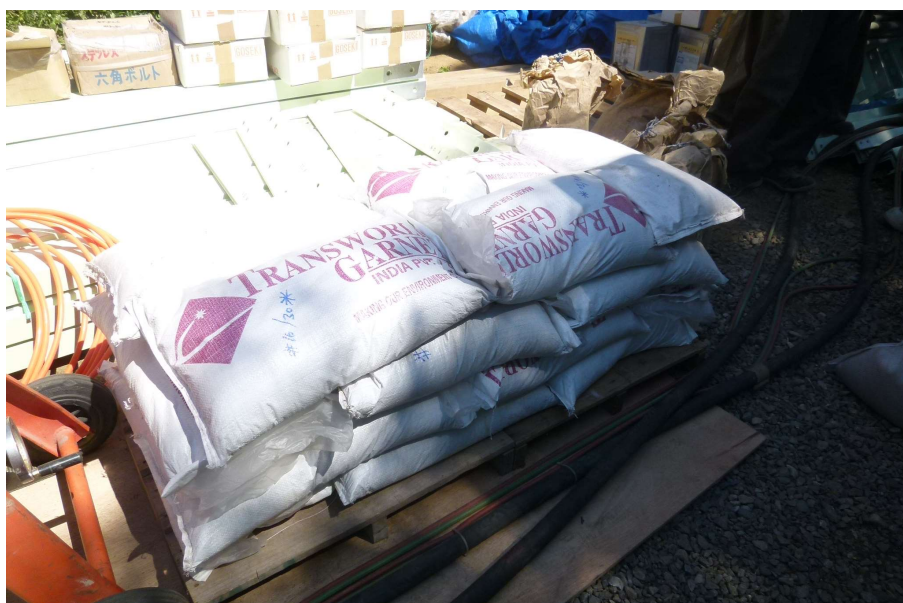
【工事種目】溶射工事