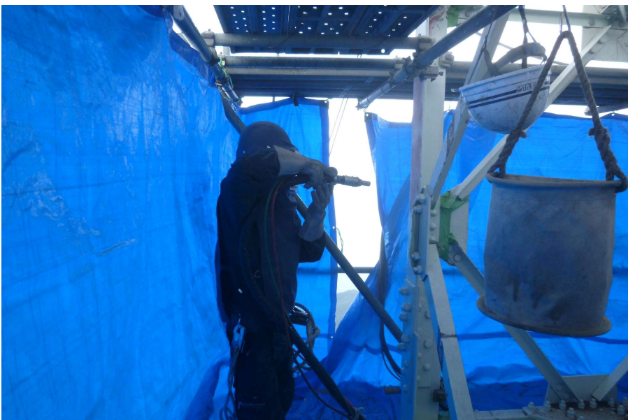
【工事種目】溶射工事