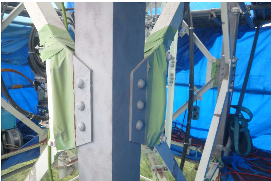
【工事種目】溶射工事