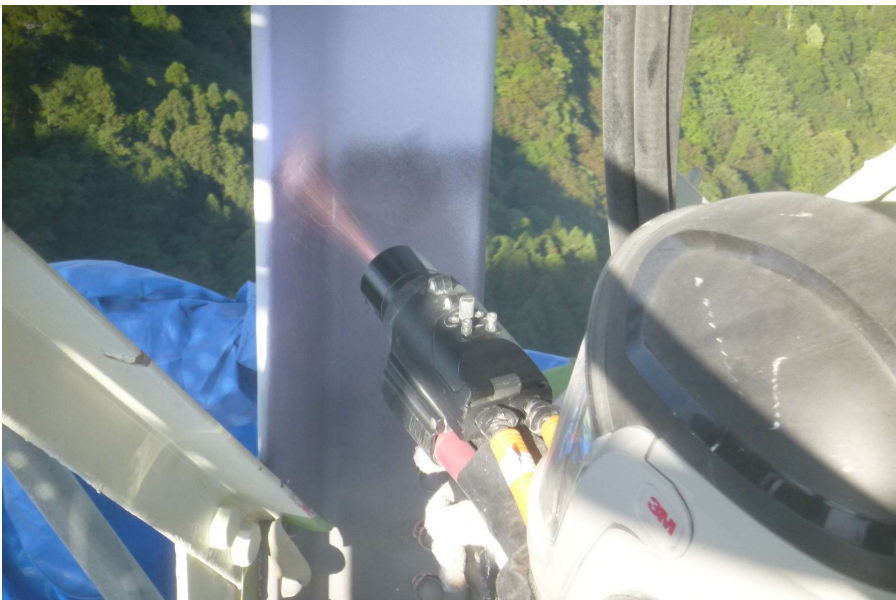
【工事種目】溶射工事 【施工内容1】溶射機材 【施工内容2】溶射ガン