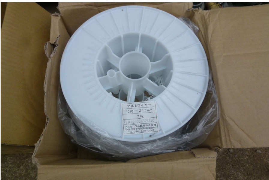
【工事種目】溶射工事 【施工内容1】溶射機材 【施工内容2】アルミ線材